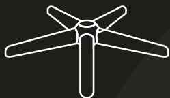
B - Base