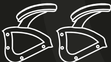
H - Apoio para os Braços